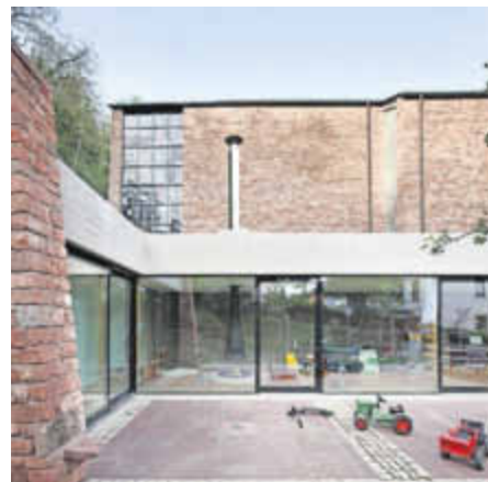
Bauen im Bestand stellt hohe Anforderungen an Architekt und Bauherrschaft. Bei dem Wohnhaus in Trier-Pallien von den Architekten Stein Hemmes Wirtz aus Kasel wurde so viel wie möglich von der Altbau-substanz erhalten.

Die Ausstellung zum „Energiepreis Architektur“, der in Rheinland-Pfalz erstmals vergeben wurde, wird in der Zeit vom 26. Juni bis 11. Juli in der Sparkasse, Viehmarktplatz, gezeigt. Die offizielle Eröffnung, zu der interessierte Bürger eingeladen sind, findet am 26. Juni um 18 Uhr statt. In der Aufsichts- und Dienstleistungsdirektion ADD, Willy-Brandt-Platz, ist die Wanderausstellung „Architekturpreis Wein 2013“ zu Gast; die Eröffnung ist am 2. Juli um 19:00 Uhr. Mehr Informationen zu den Veranstaltungen gibt es unter Tag der Architektur www.diearchitekten.org