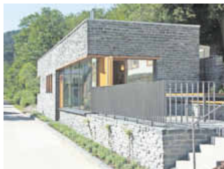
Die Tourist-Information in Ruwertal von den Architekten Stein Hemmes Wirtz aus Kasel: modern und regionaltypisch ohne Denkmaltümelei.

Im Juni 2013 zeigte eine Ausstellung mit Vorträgen zur regionalen Baukultur in den Viehmarktthemen in Trier ausgewählte Projekte in einer Vorschau. Im Rahmen der „woche der baukultur“ fin-