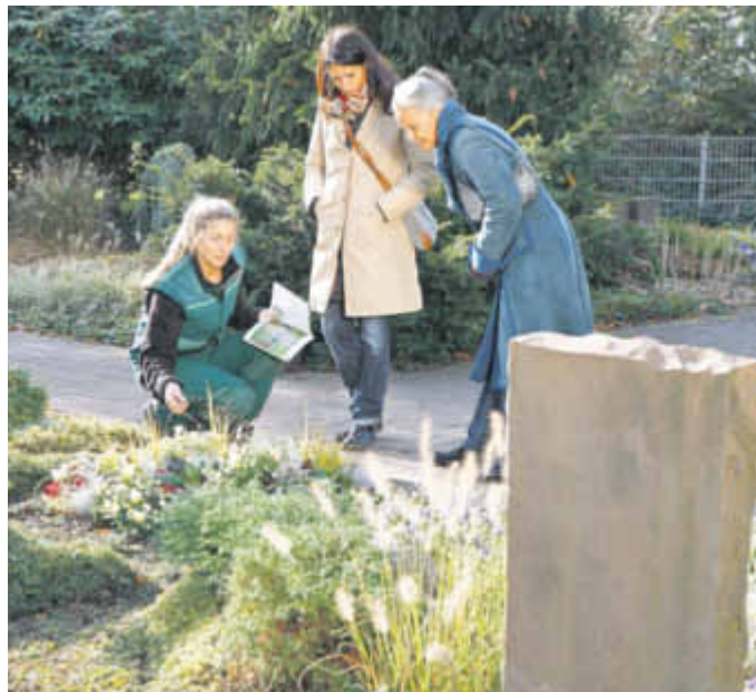
Grabpflege und -gestaltung: Friedhofsgärtner beraten ihre Kunden individuell und kompetent.