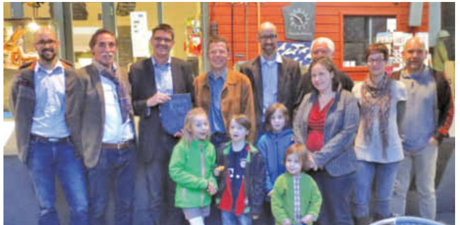
Das Besucherbergwerk Fell hat eine neue Homepage. Seit 1997 wurde das alte Schieferbergwerk von 280.000 Gästen besucht. Mit Unterstützung der Zukunftsstiftung des Kreises Trier-Saarburg wurde nun die neue mehrsprachige Seite fertiggestellt und im Beisein von Landrat Schartz vorgestellt (Foto). Mehr Infos künftig unter: www.bergwerk-fell.de