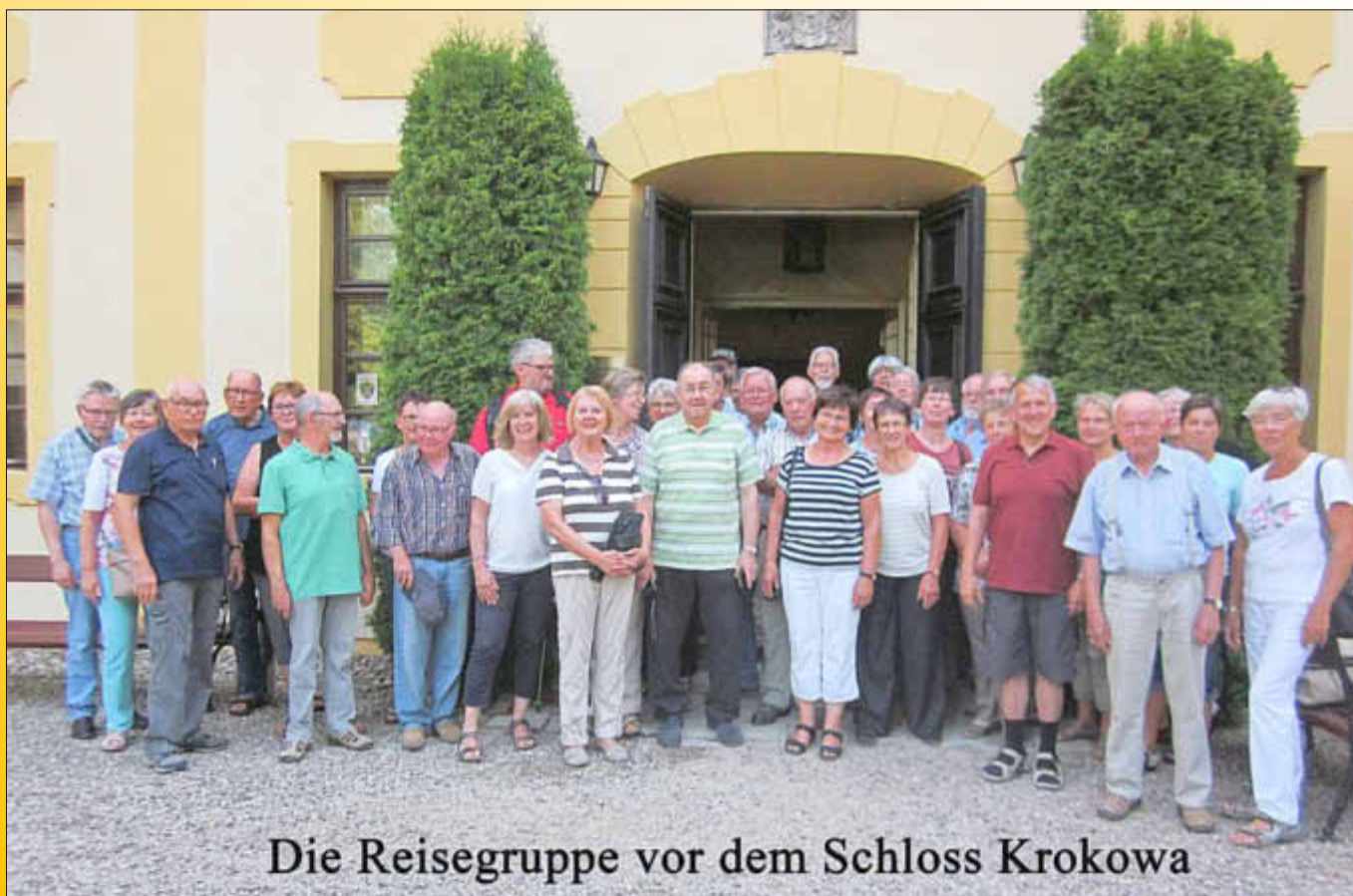
Die Reisegruppe vor dem Schloss Krokowa

Die Rückfahrt führte über Berlin. Das zentral gelegene Hotel am Checkpoint Charlie und das heiße Wetter ermöglichten noch einen abendlichen Stadtbummel, der die gelungene Reise abschloss.