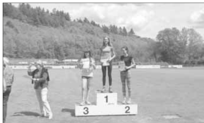
Text und Bilder: Jana Schneider