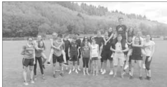
Text und Bilder: Jana Schneider

Alle Ergebnisse sind unter https://www.jugendbildungswerkstatt.de/seite/302210/aktuelles.html nachzulesen.