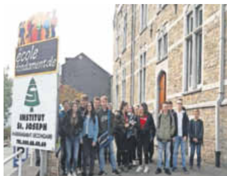
Die Jugendlichen aus Saarburg besuchten im Rahmen von SESAM'GR die Partnerschule in Belgien.

konnte die Fahrt den jungen Leuten kostenneutral angeboten werden. Die Partnerschaft der beiden Schulen besteht seit drei Jahren und soll mit einem Gegenbesuch der belgischen Jugendlichen im Laufe des Schuljahres weiter gefestigt werden.