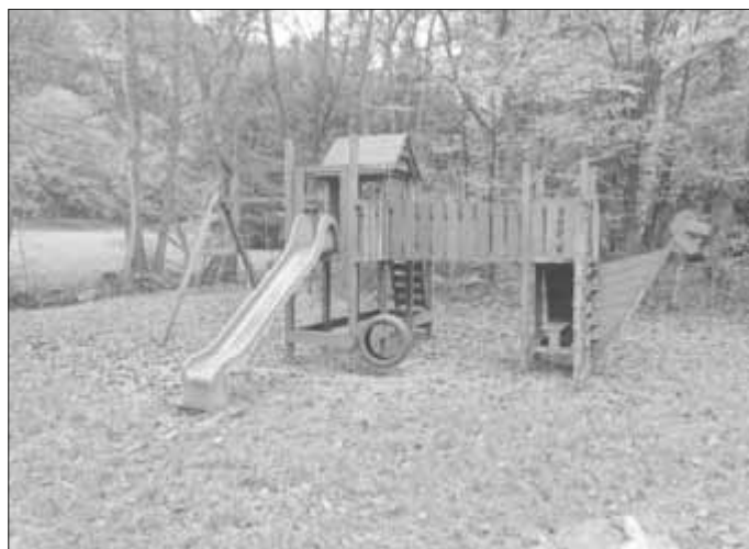
Das neue Spielgerät bietet vielseitige Spielmöglichkeiten.

Dank des Engagements und Tatkraft der Mitglieder des Vereins Wir für Fell/Fastrau e.V. (WFF) konnte im vergangenen Monat die Attraktivität unserer Feller Grillhütte weiter gesteigert werden. Hierbei wurde ein großes Spielgerät aufwändig restauriert und vor der Grillhütte als weitere tolle Attraktion installiert.