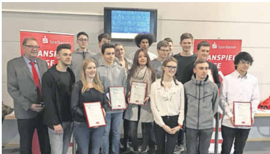
Azubis und Schülerinnen und Schüler freuen sich über die Siegerehrung im Wettbewerb „Planspiel Börse“.