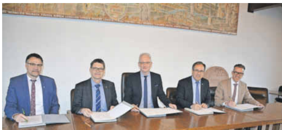
Die Vertreter der Landkreise und der Stadt Trier unterzeichneten die Zweckvereinbarung, die die Verteilung der Baukosten und der Betriebskosten für die Förderschule regelt.