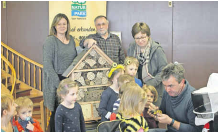
Bei den Umweltaktionstagen entdecken die Kinder die spannende Welt der Bienen.

Informationen über die Naturparke in Deutschland finden sich unter www.naturparke.de . Weitere Informationen zum Naturpark Saar-Hunsrück gibt es unter www.naturpark.org