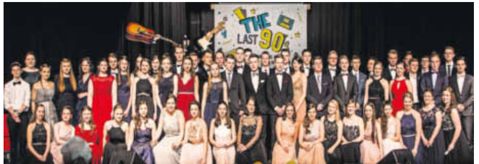
„The last 90's kids“ - die Abiturientia 2018 des Gymnasiums Saarburg