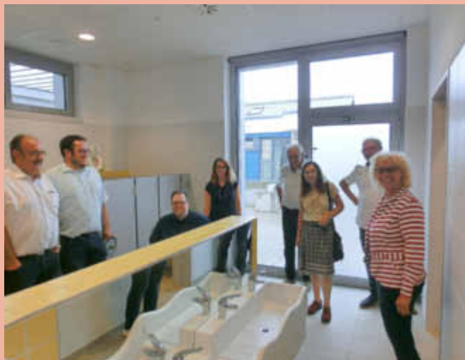
Die integrative Kindertagesstätte der Lebenshilfe ist perfekt barrierefrei für die Kleinen.