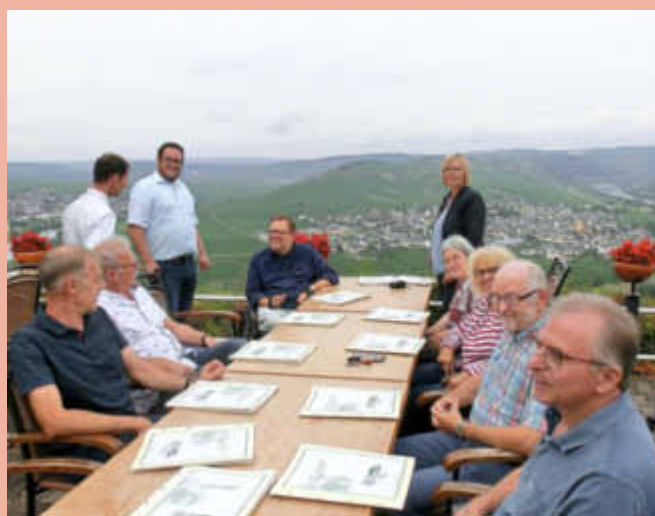
Der Abschluss der Besichtigungstour auf der Zummethöhe.