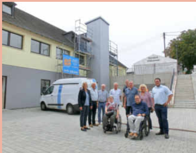
Die Grundschule Leiwien ist mit dem neuen Aufzug komplett barrierefrei.