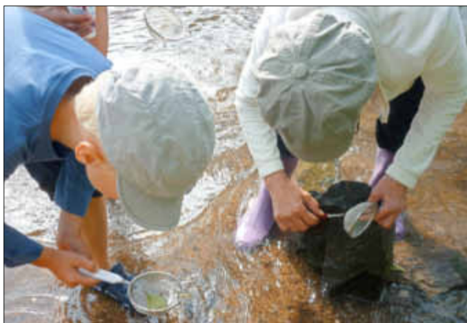
Bachuntersuchung bei den Naturerlebnistagen

Auch in diesem Jahr finden haben kleine Forscher wieder die Gelegenheit den Wald im Feller Grundtal genauer unter die Lupe zu nehmen!