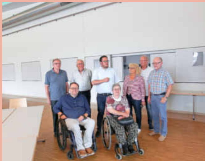
Das Forum Livia in Leiwien ist barrierefrei erreichbar.