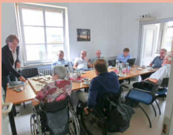
Das integrative Schulprojekt in Schweich; „2 Schulen unter einem Dach“ ist einzigartig in Rheinland-Pfalz.