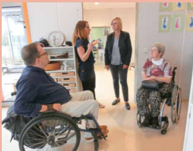
Die KiTa-Leiterin erläutert das Raumkonzept