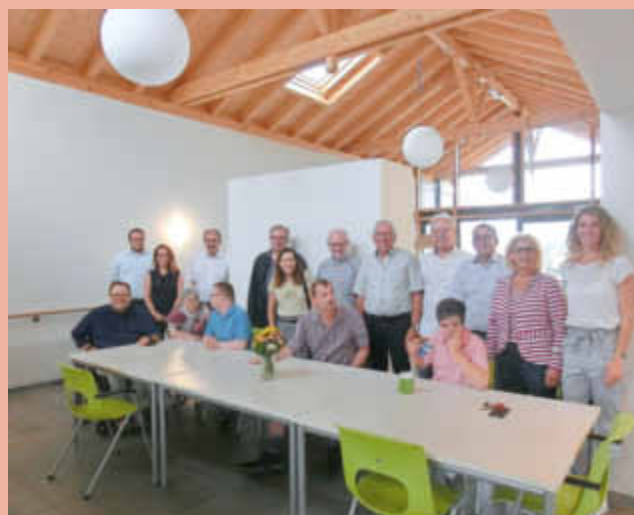
Besuch Wohnheim der Lebenshilfe in Schweich