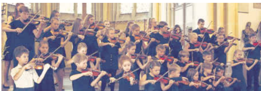
Die Geigenschüler/innen musizieren in Saarburg und Trier.