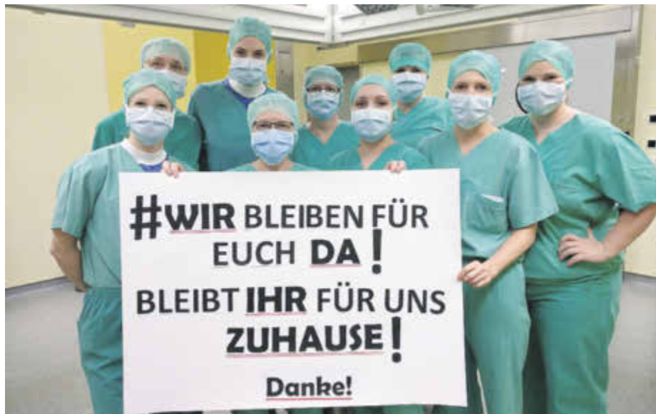
Appell des Op-Teams des Kreiskrankenhauses.

Auch auf den anderen Stationen sind alle Mitarbeiter gut vorbereitet und gehen