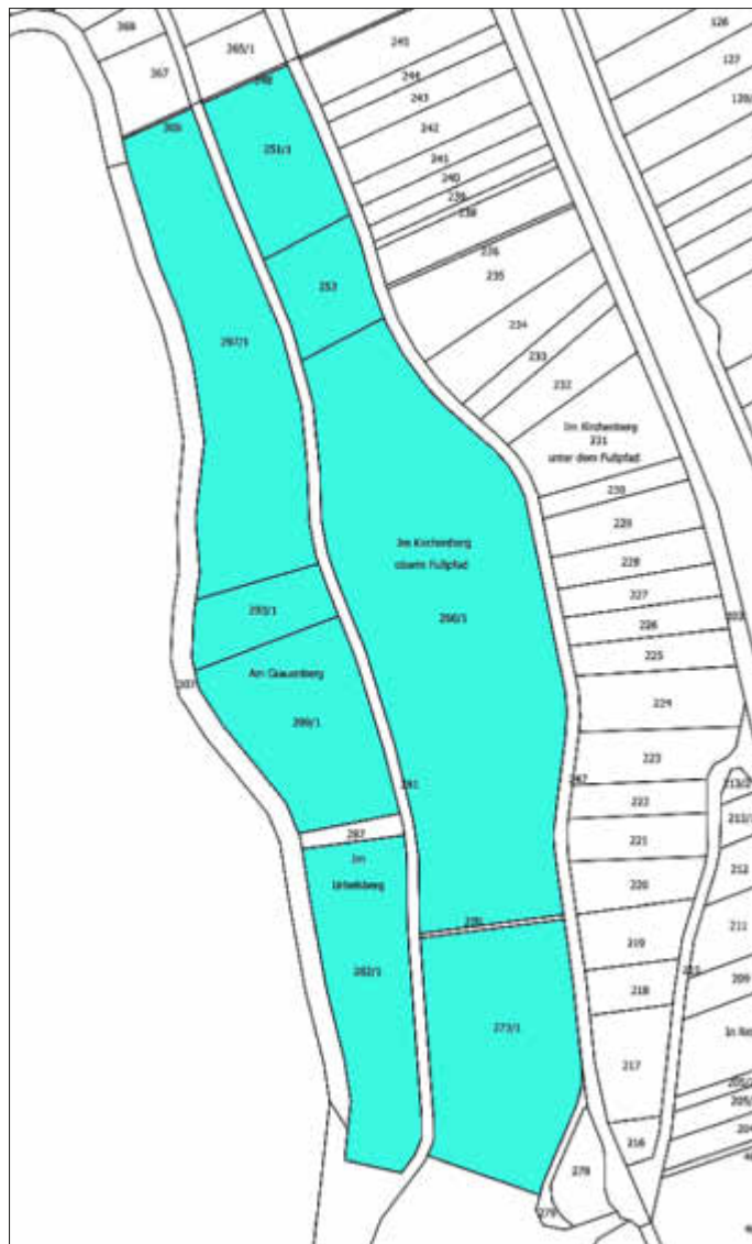
Ensch/Schleich, den 30.03.2020 Ortsgemeinde Ensch Ortsgemeinde Schleich