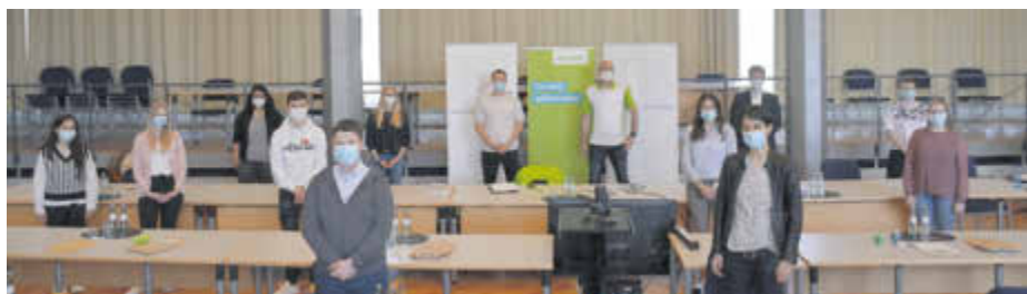
Für die neuen Auszubildenden der Kreisverwaltung stand ein Gesundheitsworkshop auf dem Programm.