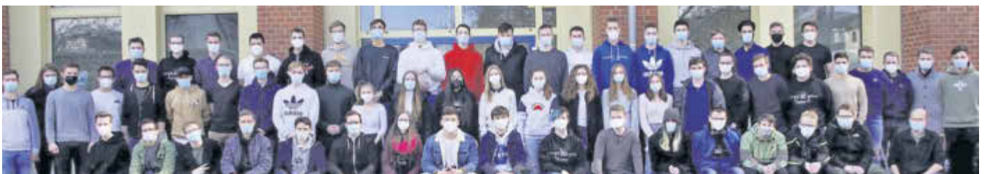
Das Foto zeigt die Schülerinnen und Schüler des kreiseigenen BNT, die verabschiedet wurden.