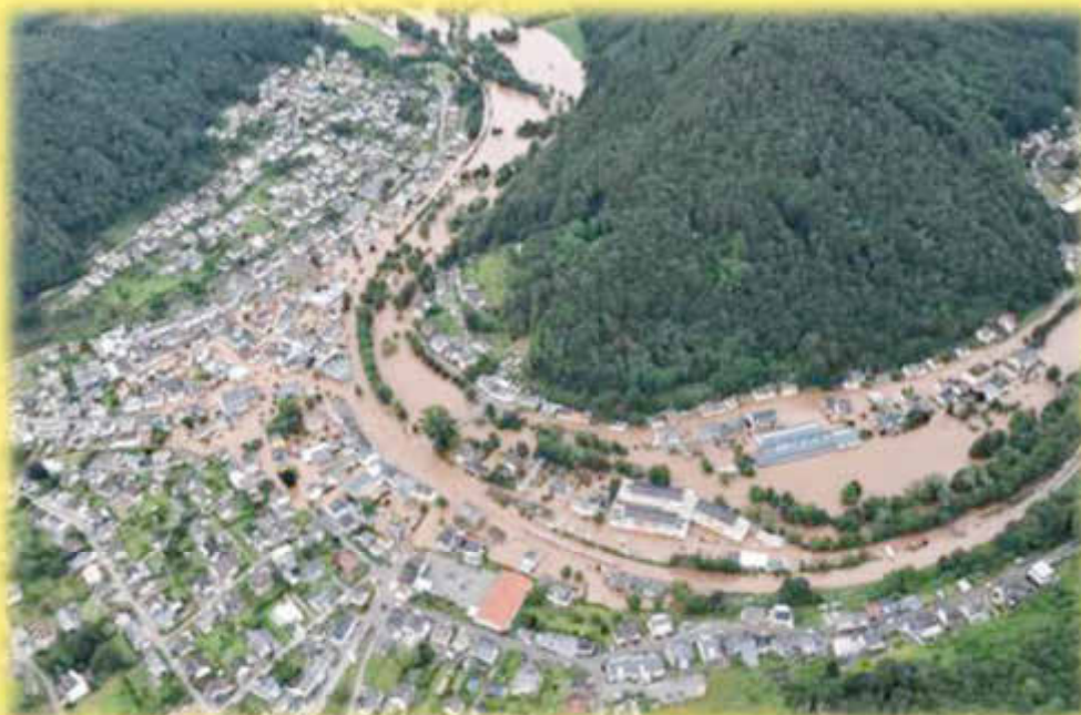
Luftbild von Kordel

Wir helfen am besten mit Geldspenden und würden uns auch über Ihre finanzielle Unterstützung freuen!