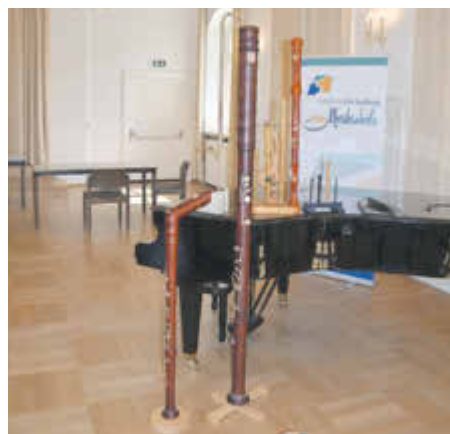
Die Blockflöte gibt es in acht verschiedenen Modellen.

den noch Instrumentenvorstellungen an öffentlichen Schulen stattfinden. „Dieses Angebot ist aber enorm wichtig, um neue Schüler zu gewinnen“, erklärt Waibel. Oft sei es auch so, dass Interessierte zwar prinzipiell ein Musikinstrument erlernen möchten, aber noch gar nicht so recht wissen, für welches sie sich entscheiden sollen.