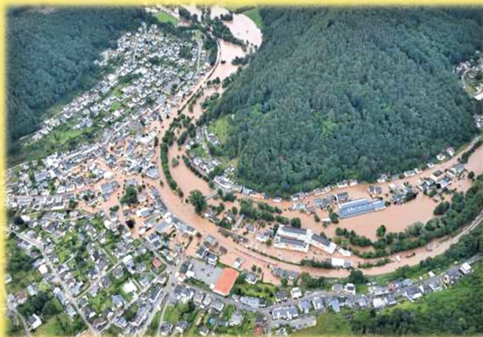
Luftbild von Kordel; Foto: Bernhard Heller (Portaflug Föhren)

Wir helfen am besten mit Geldspenden und würden uns auch über Ihre finanzielle Unterstützung freuen!