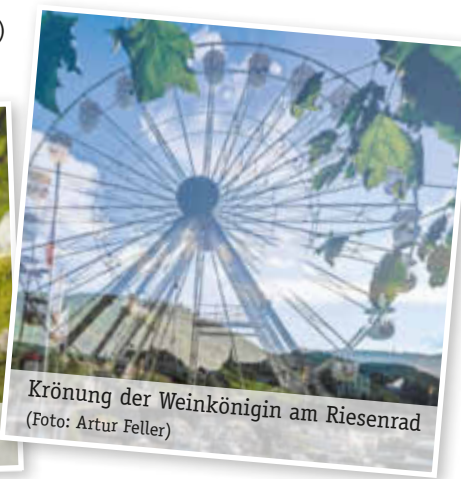
Krönung der Weinkönigin am Riesenrad