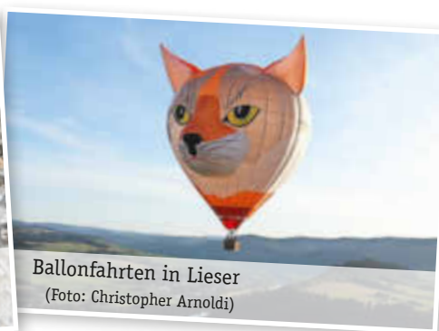
Ballonfahrten in Lieser