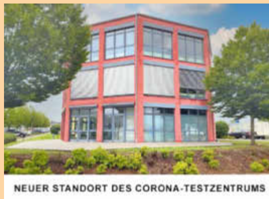
NEUER STANDORT DES CORONA-TESTZENTRUMS

Neben der neuen Lokalität sind wir nun auch auf die Imnu-Software umgestiegen, welche bereits in verschiedenen Testzentren in der Region eingesetzt wird. Diese hat den Vorteil, dass dann keine vorherige Terminreservierung mehr nötig ist. Sie können sich einfach bequem während unseren Öffnungszeiten testen lassen. Ebenso entfällt die Wartezeit auf das Testergebnis. Dieses erhalten Sie nach ca. 15 Minuten per E-Mail. Sollten Sie das Testergebnis trotzdem in Papierform benötigen drucken wir Ihnen dieses gerne vor Ort aus. Zum Test benötigen Sie lediglich Ihren Personalausweis und müssen sich unter www.imnucode.com einmalig registrieren. Anschließend erhalten Sie einen QR-Code. Mit diesem QR-Code können Sie sich an jeder teilnehmenden Teststation testen lassen. Außerdem können Sie den QR-Code zur Kontaktnachverfolgung in teilnehmenden Gastronomiebetrieben nutzen.