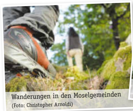
Wanderungen in den Moselgemeinden

Geöffnete Weinkeller und Weinhöfe entlang der Mosel & mehr!