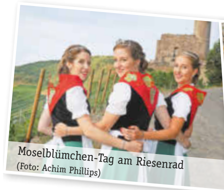
Moselblümchen-Tag am Riesenrad

Während in der Stadt die Hauptveranstaltungen mit Moselblümchentag, Krönung am Riesenrad und Konzert in den Moselauen auf die Tage Donnerstag, Freitag und Montag fallen, fallen die Highlight-Veranstaltungen der umliegenden Gemeinden meistens auf den Samstag und Sonntag. Damit rahmt die Stadt Bernkastel-Kues die Weinfeste an der Mittelmosel ein und so sorgen alle zusammen für fünf vielfältige Wein- und Genusstage.