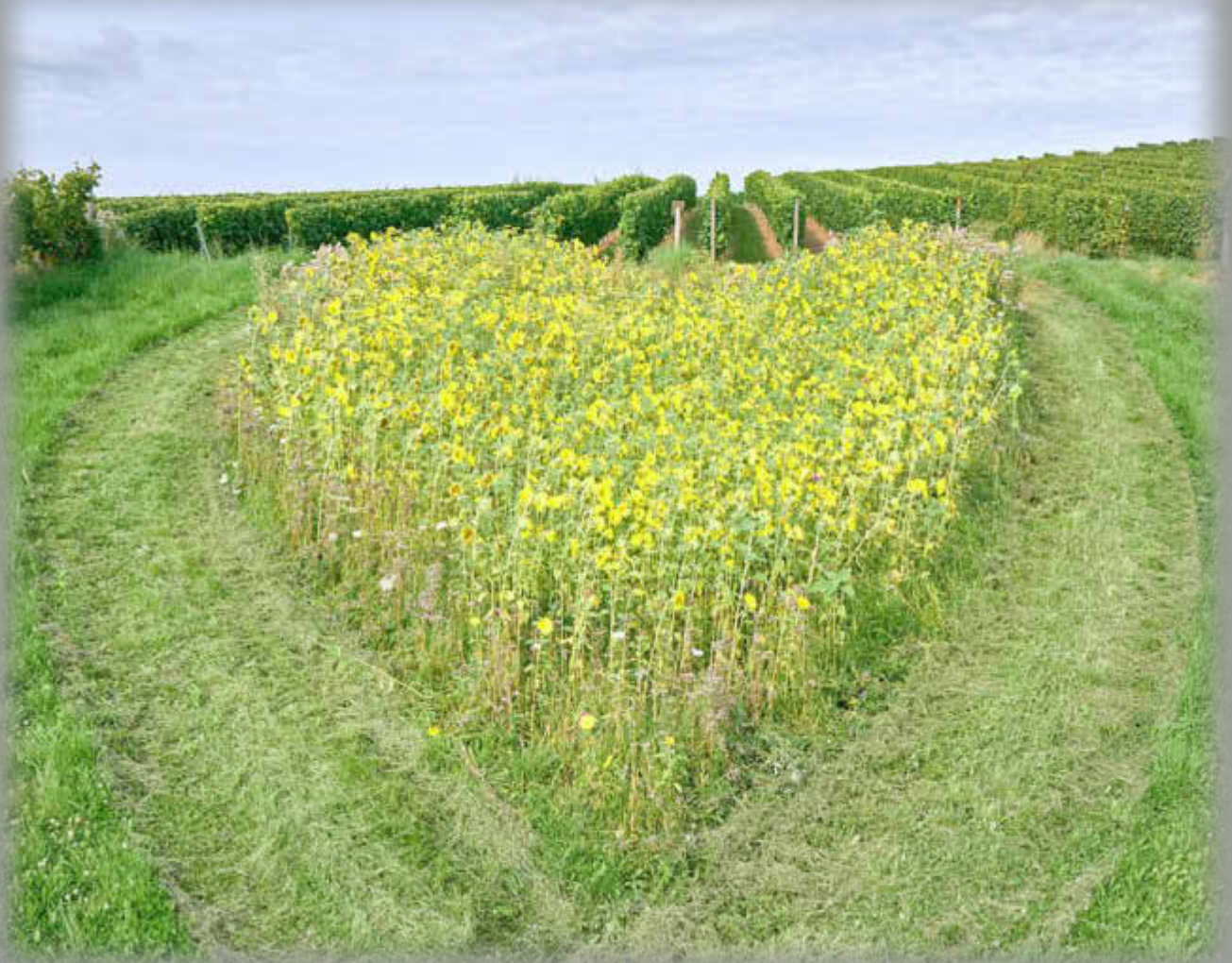
Gestaltung und Pflege des Blumenherzes: Heimat- und Verkehrsverein Bekond e. V.