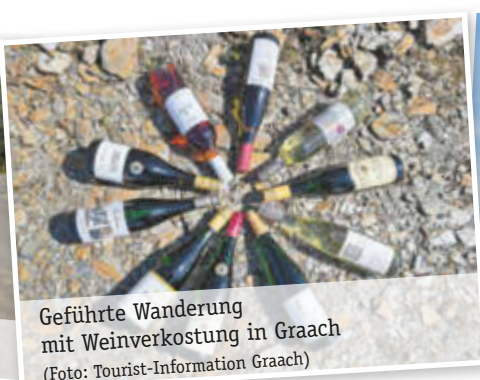
Geführte Wanderung mit Weinverkostung in Graach