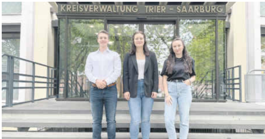
Die neue Jugend- und Auszubildendenvertretung

Auch ein duales Studium als Kreisinspektoranwärter:in mit Bachelor of Arts-Abschluss ist möglich. Dazu gehören eine zweimonatige Gastaus-