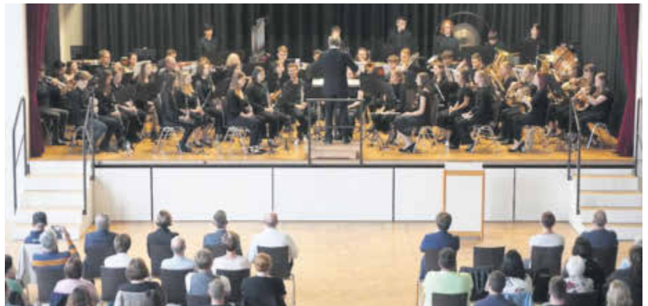
Das Kreisjugendorchester präsentierte sich vor vollem Haus im Schweicher Bürgerzentrum.

Die gute Klangqualität, die umsichtige Intonation und der ausgewogene Gesamtklang verdeutlichten die musikalische Entwicklung in der vorausgegangenen einwöchigen Sommerarbeitsphase. In Prüm hatten sich die Jugendlichen gemeinsam mit verschiedenen Dozentinnen und Dozenten auf das Konzert vorbereitet. In der profes-