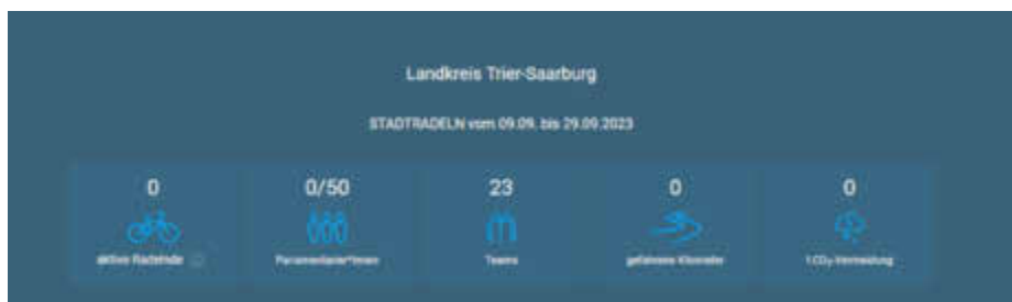
Dieses Schaubild auf der Internetseite der Aktion STADTRADELN zeigt nach Start der Kampagne im Kreis die gesammelten Kilometer und die CO 2 -Vermeidung aller Teilnehmenden.

und nicht zuletzt auch die Ermunterung, etwas für die eigene Gesundheit zu tun. Interessierte sollen motiviert werden, viele alltägliche Wege mit dem Fahrrad zurückzulegen.