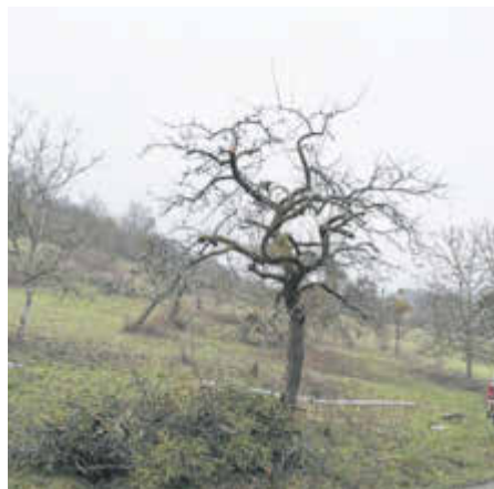
Die Bilder zeigen denselben Baum - einmal mit Mistelbefall und einmal nach Entfernen der Misteln.