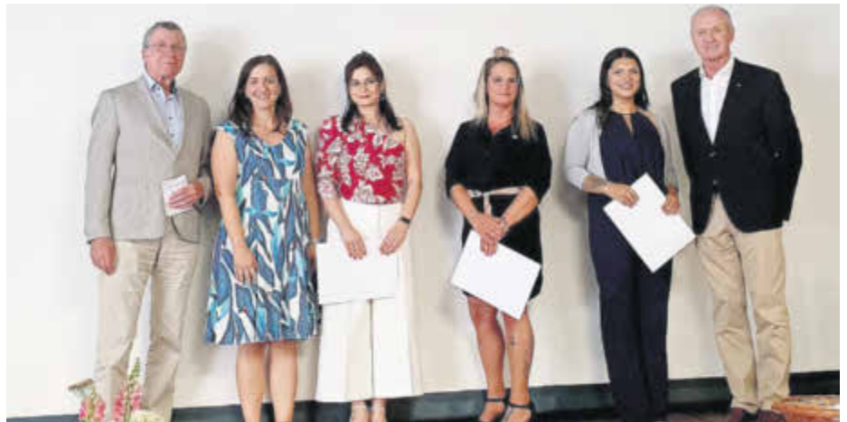
Drei Absolventinnen der Pflegefachschule erhielten Preise vom Lions Club für ihre besonderen Leistungen.