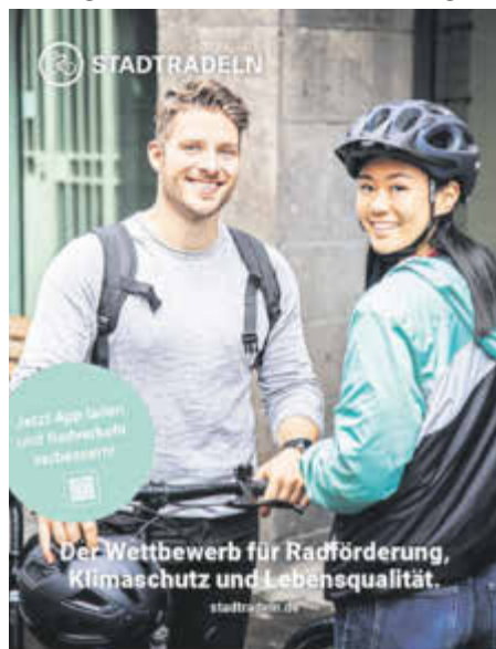
Dieses Plakat wirbt für die Aktion STADTRADELN.

Ziel ist neben dem Klimaschutz die Förderung des Radverkehrs in der Region