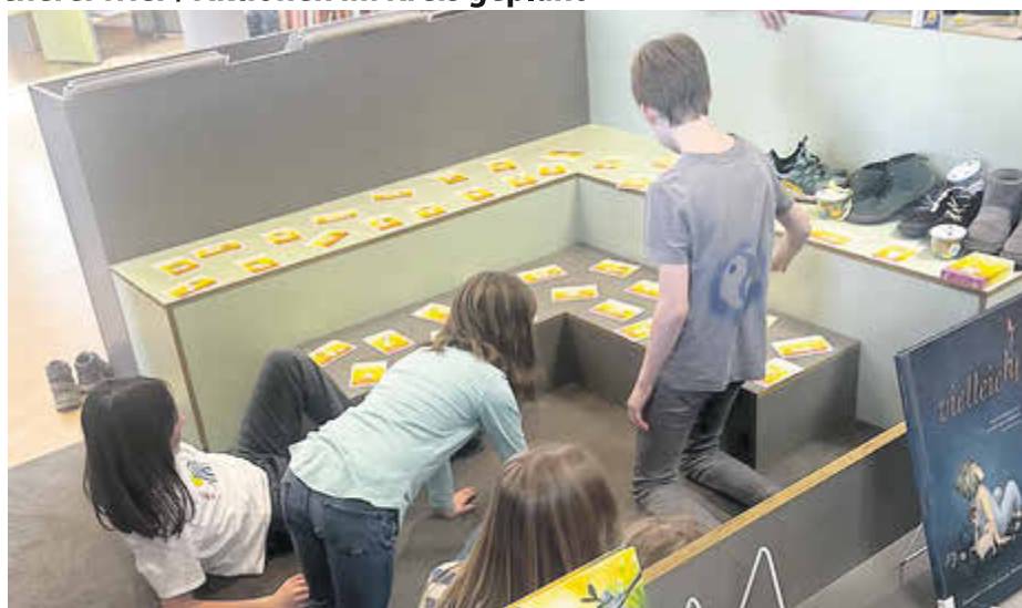
Die Kinder hatten viel Spaß bei den Mitmachaktionen.

chen, zeigten die kreativen Beiträge der Bücherclubs der Stadtbücherei: In ihren Geschichten wurde Billie beispielsweise Bürgermeister von Billiehausen – eine Figur, die selbst in schwierige Situationen gerät und lernt, dass es hilft, anderen von den eigenen Sorgen zu erzählen. Die Mitmachstationen wurden von Fachkräften des Arbeitskreises begleitet. Dieser wird durch die Netzwerkkordinierenden „Gemeinsam für den Kinderschutz“ der Stadt Trier und des Landkreises Trier-Saarburg geleitet.