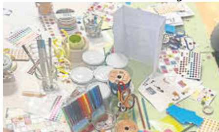
Bei Bastelaktionen konnten die Kinder ihre Stärken kennenlernen.

Dass auch Heldinnen und Helden hin und wieder mal Unterstützung brau-