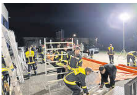
Gemeinsam wurde die Anlage zu Übungszwecken aufgebaut.

Die Dekon-Einheiten aus Wincheringen und Rodt haben daher gemeinsam mit