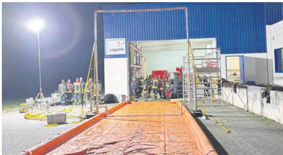
In dieser Desinfektionsanlage können auch Fahrzeuge gereinigt werden, die im Ernstfall mit Seuchen infizierte Tiere transportiert haben.

den Einsatzkräften der LF-KatS-Einheiten Mosel und Saar die Desinfektionsanlage aufgebaut. Die kontaminierten Fahrzeuge, die im Ernstfall mit Seuchen infizierte Tiere transportiert haben, werden von Einsatzkräften in Schutzausrüstung durch die Anlage geschleust.