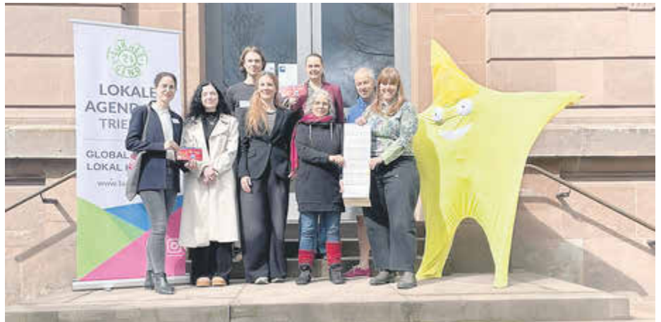
Die Verantwortlichen feierten den Auftakt des Zukunftsdiploms der Lokalen Agenda 21 im Naturpark Saar-Hunsrück.

Der Naturpark Saar-Hunsrück lädt Kinder im Rahmen des Zukunftsdiploms der Lokalen Agenda 21 Trier zu einer Vielzahl von Angeboten ein. 20 Veranstaltungen, die sich an Kinder der ersten bis sechsten Klasse richten, sind geplant. Die Themen sind vielfältig und reichen von spannenden Biber- und Fledermauswanderungen, Wildkräuterwanderungen, Entdeckungstouren auf der Projektfläche „Baumstark für Alle“, Upcycling-Workshops mit Naturmaterialien über Räucherworkshops bis hin zur Herstellung von Adventsgestecken und dem Bauen von Nisthilfen.