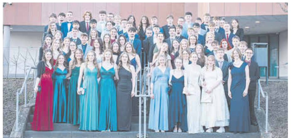
Der Abitur-Jahrgang 2026 des Gymnasiums Saarburg