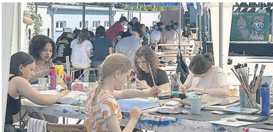
Bei verschiedenen Kursen konnten die Jugendlichen ihrer Kreativität freien Lauf lassen.

Künstlerisches Handeln ist besonders für junge Menschen eine wichtige Ausdrucksform, die ihren Themen, Bedürfnissen und Gefühlen Ausdruck verleiht und sie sichtbar macht. Es fördert damit nicht nur die kulturelle, sondern auch die gesellschaftliche Teilhabe. Insbesondere im ländlichen Raum besteht ein ungedeckter Bedarf an niedrigschwelligen jugendkulturellen Angeboten. Das besondere Projekt „Rollendes Kunstatelier“ schließt diese Lücke und ergänzt das Angebot der dezentralen Kinder- und Jugendarbeit im Landkreis.