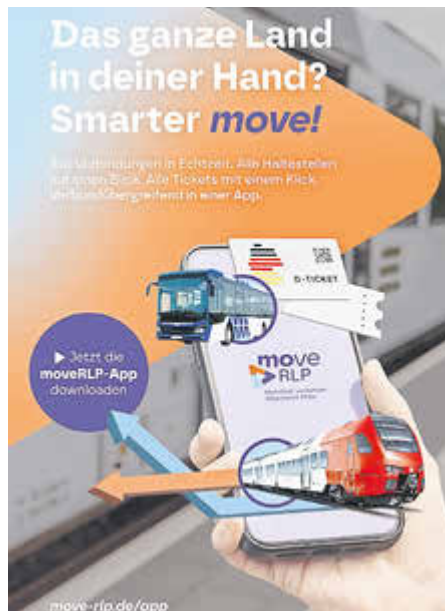
Die App gibt es für iPhone und Android.

lassen sich beispielsweise Verbundfahrkarten im Vor- oder Nachlauf mit einer Fahrkarte des Deutschland-Tarifs verbinden.