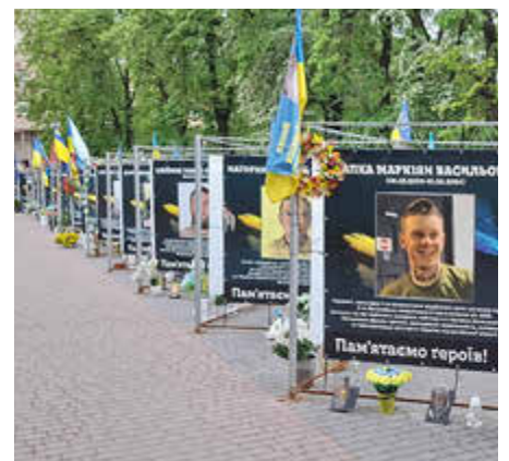
In den Städten erinnern Gedenktafeln an hunderte gefallene Soldaten.