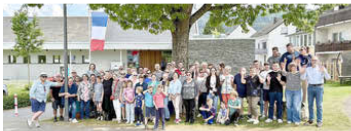
Unsere französischen Gäste mit ihren Gastfamilien

liebe Freunde der deutsch-französischen Partnerschaft, am 09. und 10. Mai 2026 waren unsere Freunde aus der Partnergemeinde Ligny-le-Châtel im Burgund bei uns zu Gast. Wir freuen uns sehr, dass aus beiden Gemeinden wieder viele neue Familien dazugekommen sind. Bei wunderbarem Frühlingswetter konnten wir den neuen Besuchern einen grandiosen Ausblick auf das Moseltal vom Huxlay-Plateau aus gewähren. Bei einem sonnigen Picknick und guten Gesprächen war genug Gelegenheit, die Gäste kennenzulernen oder bestehende Freundschaften zu vertiefen. Ein besonderes Highlight war in diesem Jahr wieder das Bankett für alle im Dorf- und Kulturzentrum bei guten Essen und Rioler Weinen.