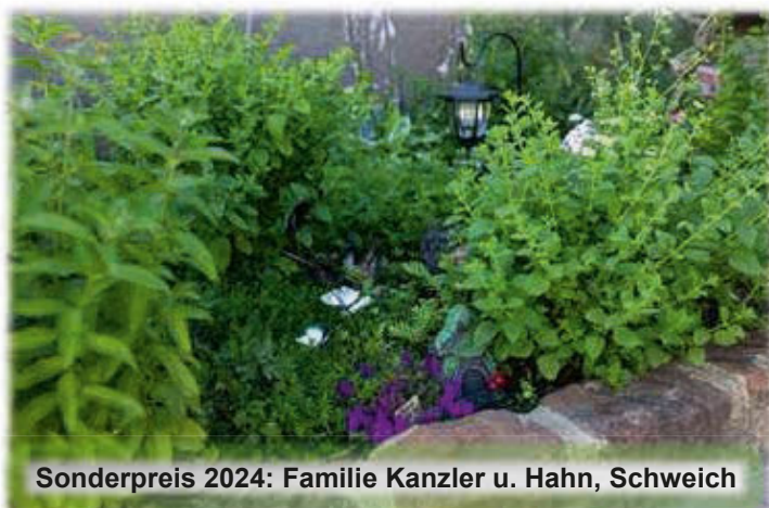
Sonderpreis 2024: Familie Kanzler u. Hahn, Schweich

canadensis), Scharfer Mauerpfeffer (Sedum acre), Blutroter Storchschnabel (Geranium sanguineum), Teppich-Phlox (Phlox subulata), Blaukissen (Aubrieta deltoidea).