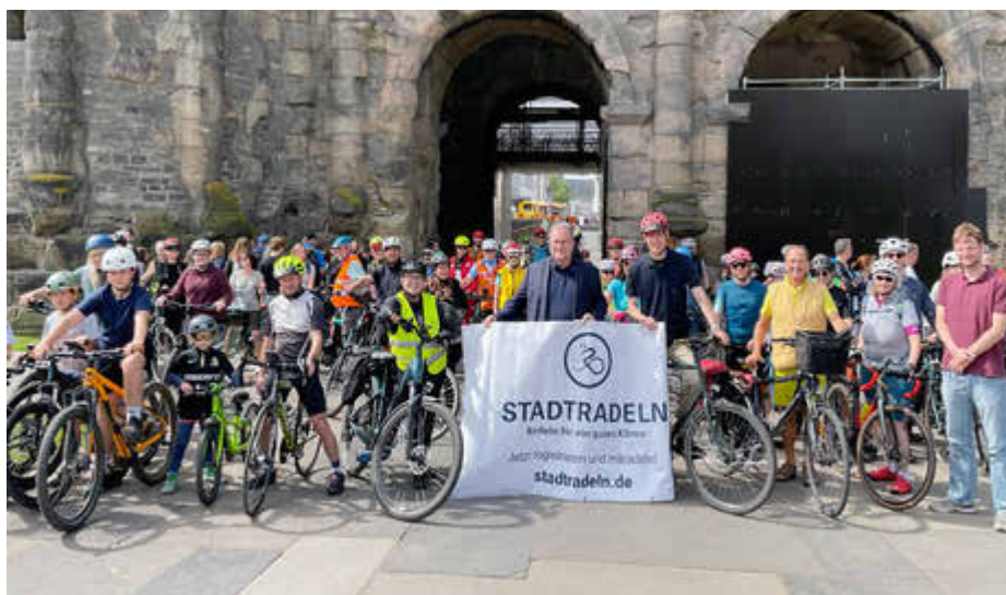
Viele Radfahrer:innen waren bei dem offiziellen Auftakt der Aktion Stadtradeln vor der Porta Nigra dabei.

Bereits seit Mitte April bieten die Klimaschutzmanagements der Stadt Trier und des Landkreises Trier-Saarburg verschiedene Fahrradhighlights an. Auch zum