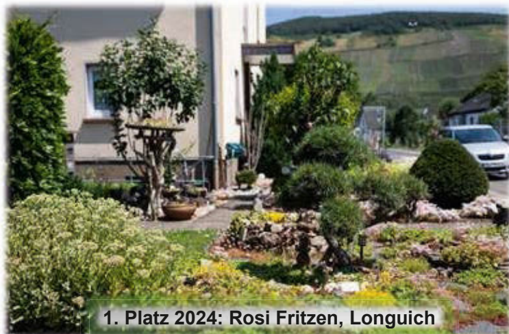
1. Platz 2024: Rosi Fritzen, Longuich

Nach einer Pause im vergangenen Jahr lobt die Verbandsgemeinde Schweich erneut den Wettbewerb aus. Bedingt durch den Rückgang der Artenvielfalt bei Pflanzen und Insekten besteht ein wachsender Bedarf, einem weiteren Aussterben aktiv entgegen zu treten. Jeder kann dazu beitragen, mit Hilfe der richtigen Pflanzen das Nahrungsangebot für diese Tiere zu erhöhen und somit einen Lebensraum zu schaffen, in dem sie sich wohlfühlen und vermehren können.