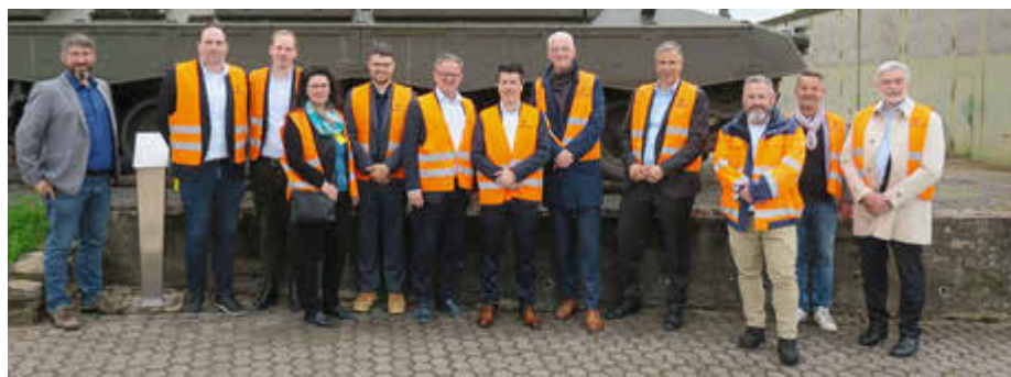
Mit einer großen Delegation besuchten Landrat Stefan Metzdorf (6.v.l.) und Oberbürgermeister Wolfram Leibe (5.v.r.) die Wehrtechnische Dienststelle in Trier.

Zur Unterstützung des Teams sucht die Kreisverwaltung Trier-Saarburg regelmäßig neue engagierte Mitarbeitende in vielfältigen Bereichen. Aktuelle Stellenausschreibungen finden sich auf der Homepage des Landkreises unter www.trier-saarburg.de/jobs . Dort gibt es auch weitere Informationen zu den Aufgabenbereichen und den Anforderungsprofilen.