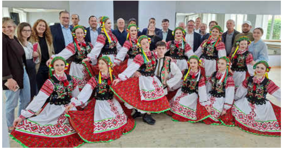
Im Kulturkolleg Kalusch führten Schülerinnen und Schüler ukrainische Volkstänze für die deutschen Gäste auf.