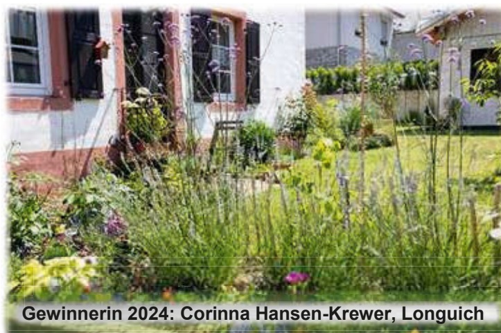
Gewinnerin 2024: Corinna Hansen-Krewer, Longuich

Auch Sonderpreise können vergeben werden.