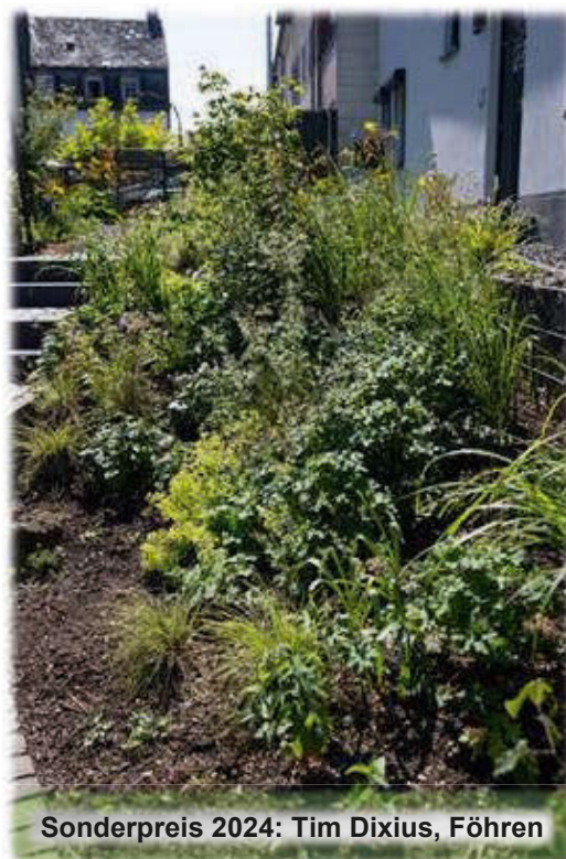
Sonderpreis 2024: Tim Dixius, Föhren

Wir hoffen natürlich auf eine rege Beteiligung an diesem Wettbewerb und freuen uns über viele schöne Vorgärten