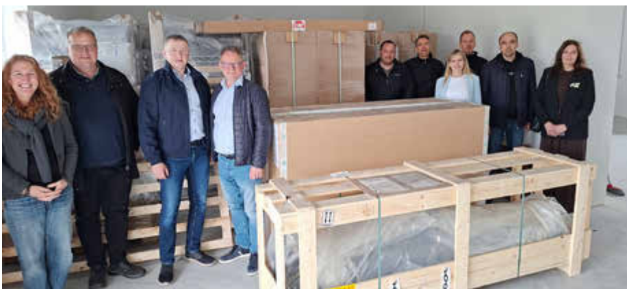
Die komplette Einrichtung eines Reha-Zentrums wurde im Beisein der Delegation des Kreises von Stefan Metzendorf an Landrat Mykhailo Lavriv (3.v.l.) übergeben.

„Wir werden unsere Hilfen fortsetzen und haben gesehen, wo sie am nötigsten gebraucht werden. Daneben wollen wir aber auch schon an die Zukunft denken, wenn dieser furchtbare Krieg endlich zu Ende ist.“ Darin war sich Landrat Metzendorf mit seinem ukrainischen Amtskollegen Mykhailo Lavriv einig.